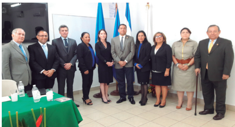
Magistrados de la CCJ con autoridades de la Universidad del Valle.

La visita se llevó a cabo el 1 de diciembre del 2016.