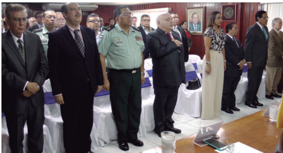
Magistrado Vicepresidente de la CCJ, Embajadores, autoridades académicas e invitados especiales.

El acto contó con la presencia de distinguidas personalidades del Cuerpo Diplomático acreditado en Nicaragua, así como de altas autoridades académicas y representantes de Poderes del Estado, Organismos Regionales, instituciones públicas y privadas de esta ciudad, entre otros.