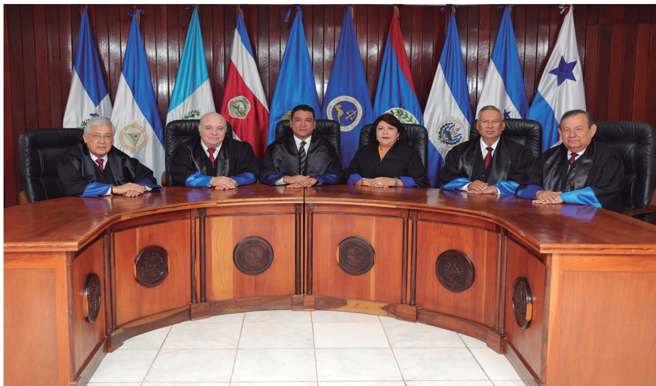
Excelentísimos Magistrados y Magistrada de la Corte Centroamericana de Justicia.

Es el Tribunal que mejor garantiza el acceso a su jurisdicción (jus standi).