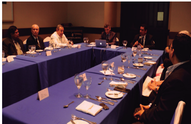
Magistrados, Magistrada y Funcionarios participantes del Conversatorio.