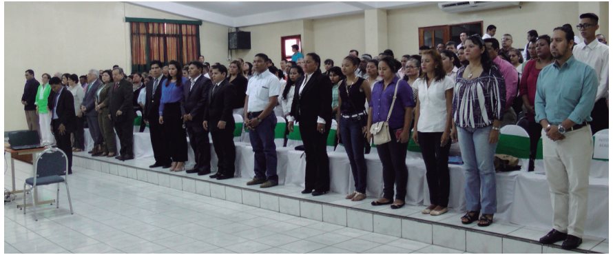
Excelentísimos Magistrados, Magistrada y público asistente a la presentación de la obra.