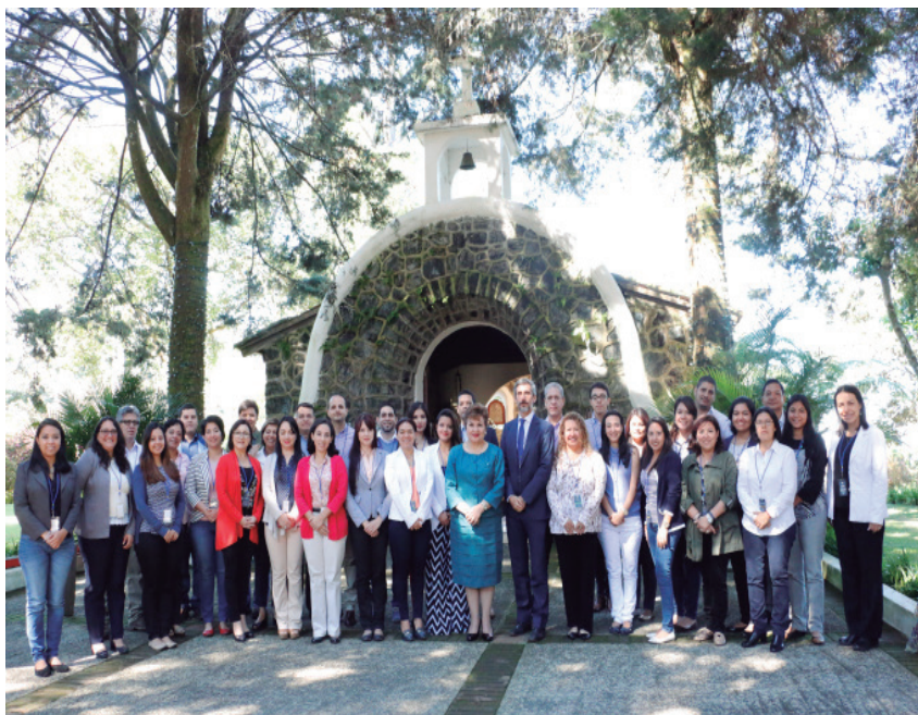
Comunicadores de Secretarías y Órganos del SICA.

Es importante destacar que estos encuentros pretenden no dejar por fuera el acompañamiento comunicacional del proyecto político que lideran los presidentes de la región, siendo un binomio social de estricto entendimiento que a su vez requiere del cumplimiento de los sectores involucrados para continuar con los esfuerzos multisectoriales dirigidos a un bien común y por ello, erigiendo una región cada vez más involucrada en el desarrollo de sus políticas públicas, aterrizadas a sus realidades.