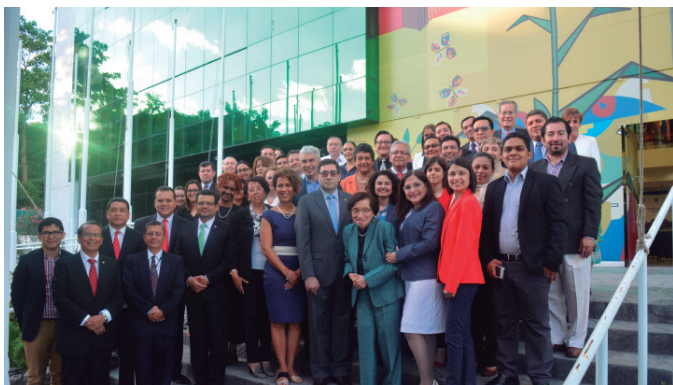
Asistentes al Foro de COMISCA.

Los días 10 y 11 de noviembre del año 2016, la CCJ fue invitada al Foro “Los retos comunes de la institucionalidad del SICA para el cumplimiento de los objetivos de Desarrollo Sostenible: la necesaria intersectorialidad y el rol de las políticas regionales desde la perspectiva de la salud regional”.