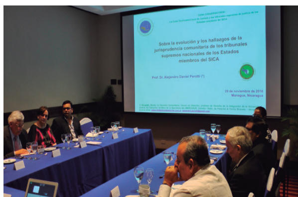
Magistrados, Magistrada y Funcionarios participantes del Conversatorio.