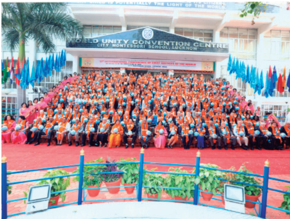
Magistrados y Magistradas asistentes a XVII Conferencia Internacional de Jefes de Justicia del Mundo en la India.