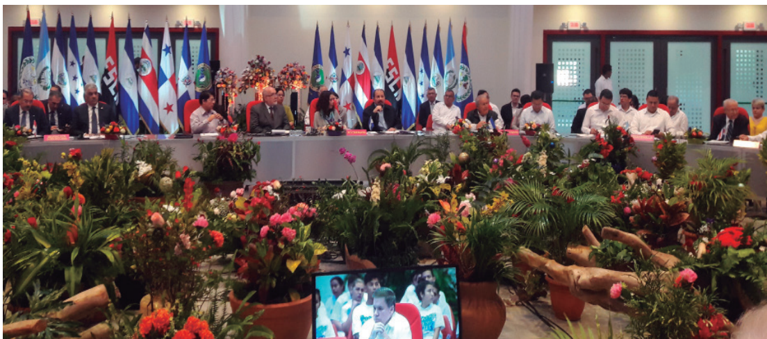
Excelent simos Presidentes y Representantes de los Estados pertenecientes al SICA.

El d a 20 de diciembre del 2016, en la ciudad de Managua, se llev  a cabo la Reuni n de Cierre de la PPT-SICA-Nicaragua y traspaso a la Rep blica de Costa Rica, ocasi n en que se presentaron los avances del SICA durante el segundo semestre del 2016.