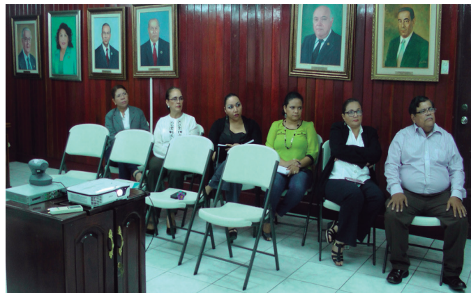
Funcionario y personal administrativo.