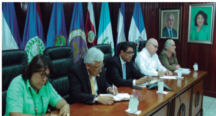
Excelentísimos Magistrados, Magistrada y Secretario General.