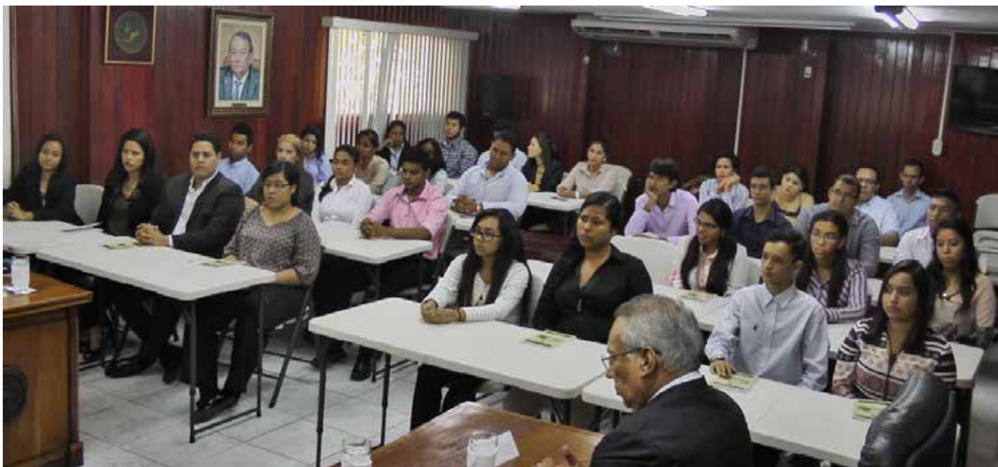
Alumnos de las carreras Relaciones Internacionales y Derecho.