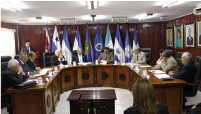
Pleno de La Corte Junto con El Honorable Diputado Mario Taracena Diaz, Presidente del Congreso de la Rep blica de Guatemala y Presidente Pro Tempore de FOPREL.

FOPREL es un organismo regional colegiado y permanente, integrado por los Presidentes de los Poderes Legislativos de los pa ses suscriptores del Acta Constitutiva y aquellos que en lo sucesivo se adhieran, sustentados en la integraci n del  rea. El evento se realiz  el d a 5 de mayo, en la sede de La Corte.