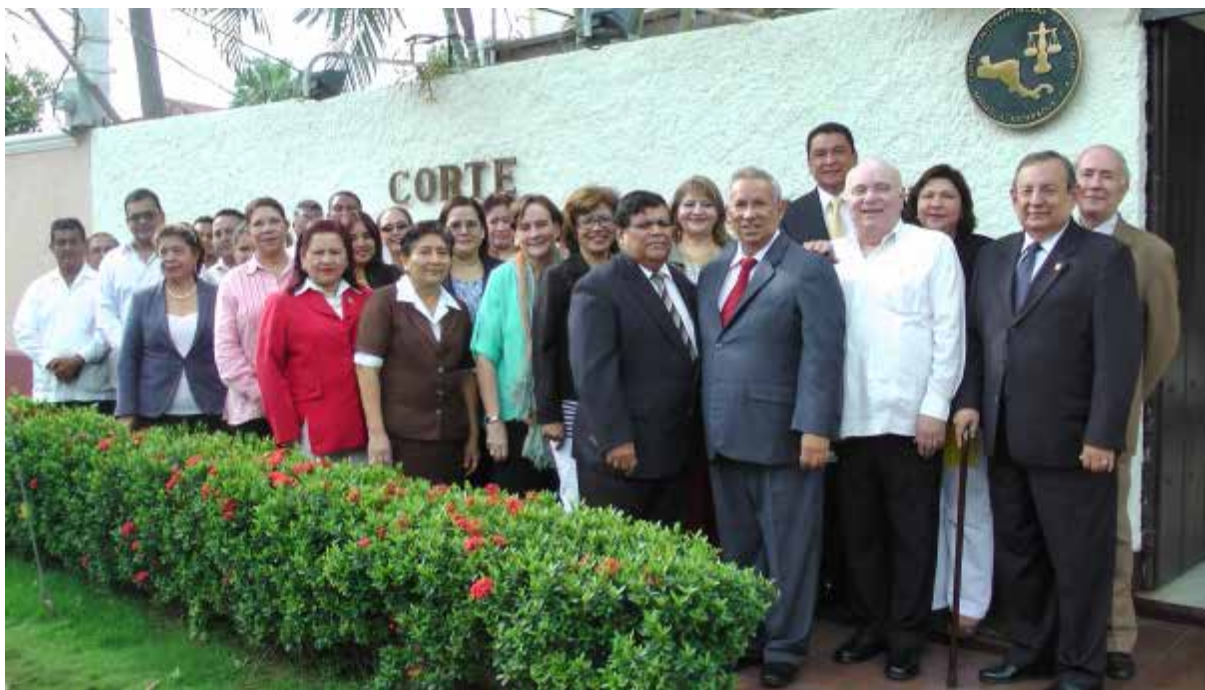
Magistrados, Magistrada y personal de la CCJ.

Con un sentimiento patriótico centroamericano y unionista las autoridades de La Corte conmemoraron las fiestas patrias de la Región, con un sencillo acto en la Sede de la CCJ, para izar las banderas de Nicaragua, país Sede y de la Corte Centroamérica de Justicia.