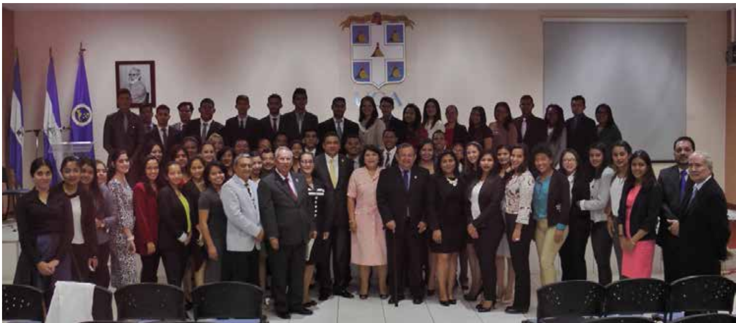
Magistrados de la CCJ junto con autoridades de la UCA y UNICAH, rodeados de alumnos asistentes de esta casa de estudios.

El día 19 de agosto del 2016, en el auditorio Xavier Gorostiaga de la Universidad Centroamericana (UCA) Magistrados de la Corte Centroamericana de Justicia (CCJ), recibieron la visita de altas autoridades académicas profesores y estudiantes de la Universidad Católica de Honduras “Nuestra Señora Reina de la Paz” (UNICAH) .