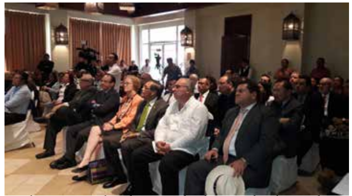
Excelentísimos embajadores acreditados ante el Gobierno de Nicaragua e invitados especiales asistentes al lanzamiento del Portal de la CCJ.