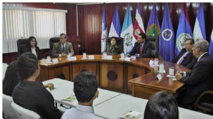
Autoridades de la UNICIT, junto con Magistrados y Magistrada de la CCJ.

de los estudiantes de la Universidad Iberoamericana Ciencia y Tecnología quienes expresaron sus puntos de vista y dudas sobre el Derecho Comunitario, interrogantes que fueron resueltas por los Magistrados de la Corte Centroamericana de Justicia, los cuales dejaron una invitación abierta para brindar conferencias en otras Universidades, como parte del compromiso de estrechar lazos con las universidades centroamericanas. El día 30 de junio se realizó la visita de los estudiantes.